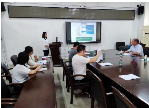
毛好喜指导青年教师提升职教能力