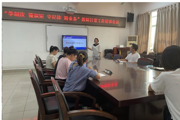
学生管理科培训会场