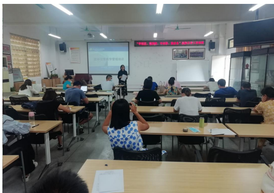
公共基础部培训会场