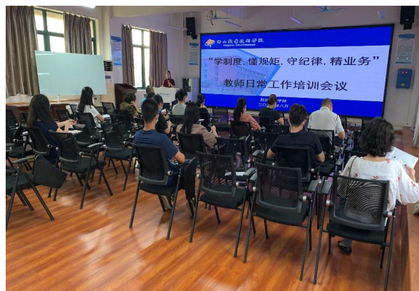
旅游管理系培训会场