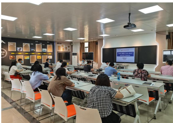
金融与财会系培训会场

为了加强教师日常教学质量，强化教师质量规矩意识，保障正常稳定的教学秩序，财经管理学院于2021-2022学年第一学期开学第一天组织全体教师开展日常教学管理及质量规范培训会议。会议由各部门负责人主持，学院领导班子成员分别出席各部门会议，各系部全体教师参加培训。